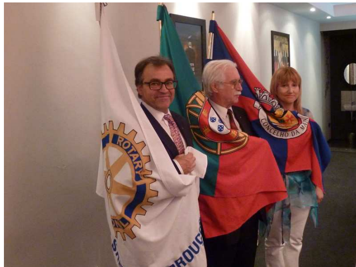
Transmissão de Tarefas no RC de Águas Santas Pedrouços: 28 Jun 2013