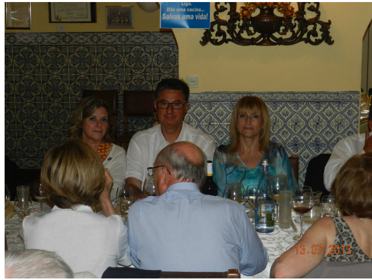
1º VOG da Dist 1970 de RI no ano rotário 2013|14: 13 Jul 2013