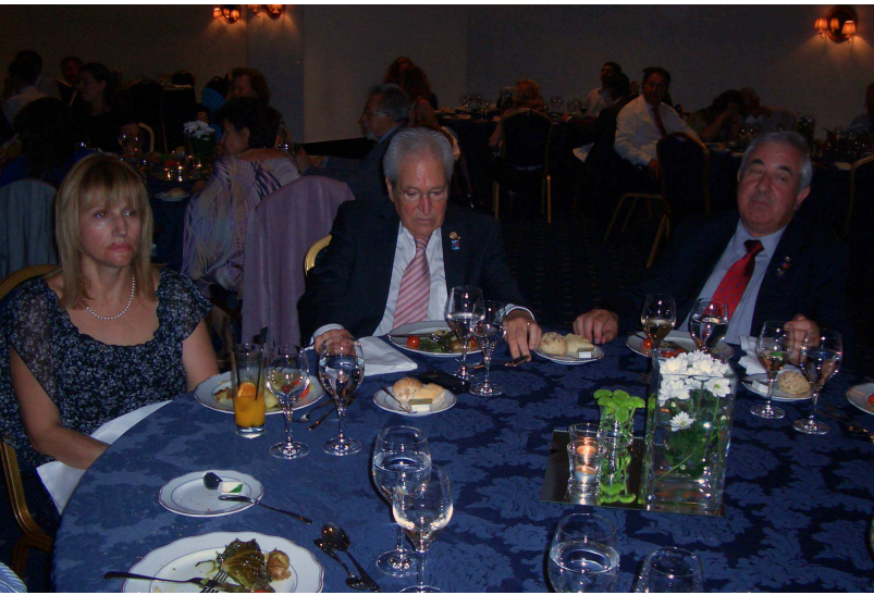
TT do RC de Vila Nova de Gaia: 4 Jul 2013