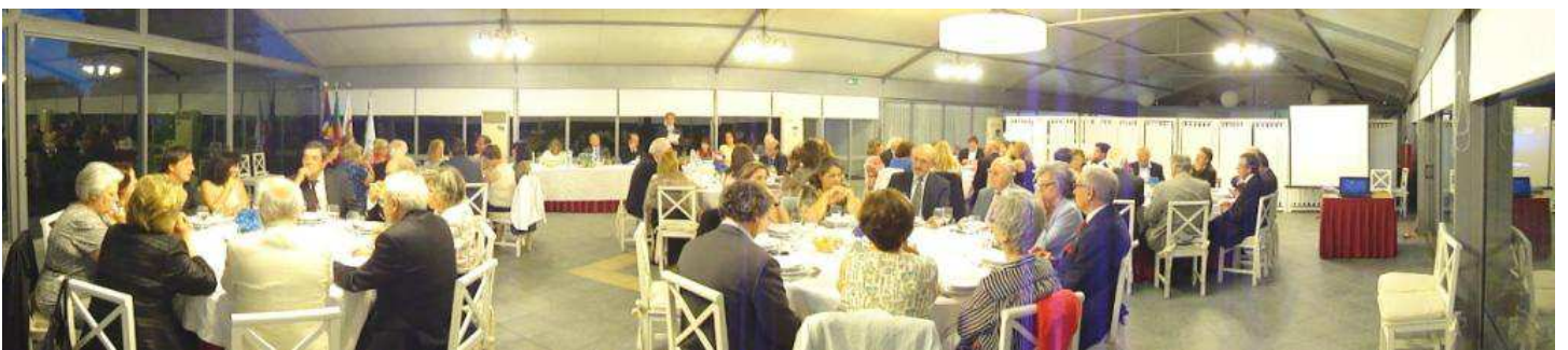
Transmissão de Tarefas do Rotary Club da Maia: 2 Jul 2013